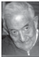
Joan Coromines (1905-1997)