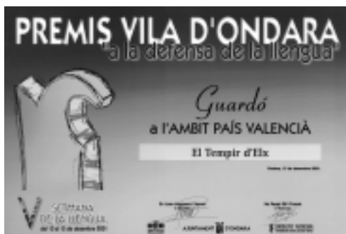
El Tempir rep el Premi Vila d'Ondara a la defensa de la Llengua.

TEMPIR d'Elx dins la I Setmana dels Jaume I a la població de Calaceit, a la comarca del Matarranya (Franja de ponent). Vegeu pàg. 16.